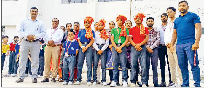
राजौद। विजेता खिलाड़ियों का स्कूल में जोरदार स्वागत करते हुए।

अस्पतालों में बेहतर इलाज, दवायों और जांच मशीनों की कमी के कारण मरीज पहले ही प्राइवेट अस्पतालों का रुख कर रहे थे।