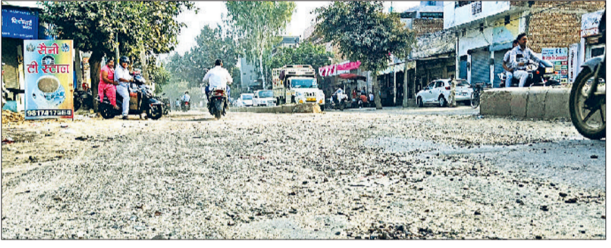
जीद। जर्जर हालत में रोहतक रोड।

जगह-जगह सैकड़ों गहरे गड्डे, धूल का अत्यधिक स्तर गंभीर समस्या