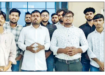
जीद। कुलसचिव से मिलने जाते संगठन सदस्य।