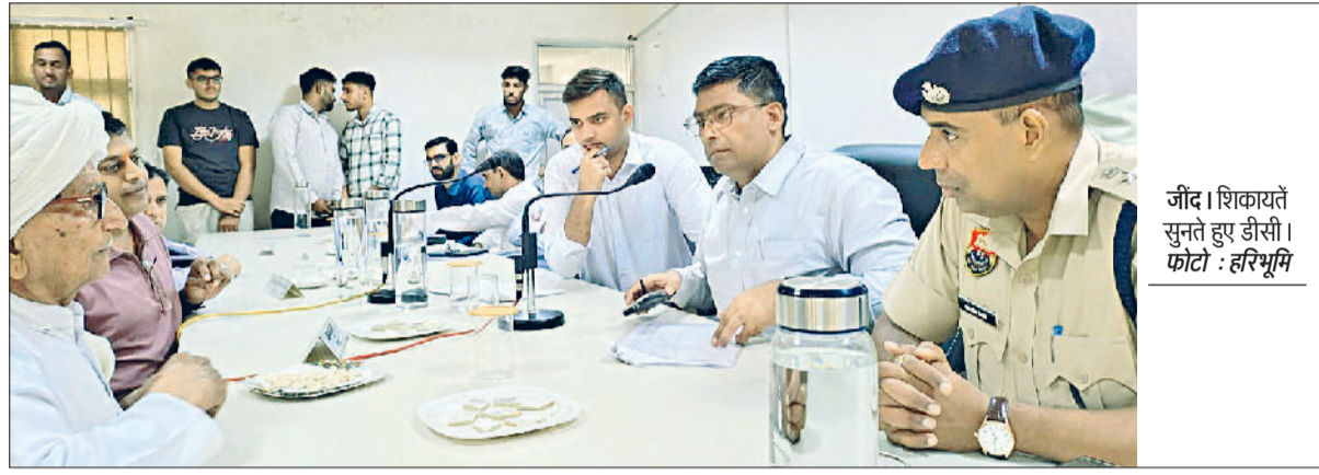
जींद। शिकायतें सुनीं हुए डीसी।