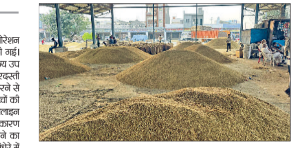
जुलाना। अनाजमंडी में पड़ी धान।