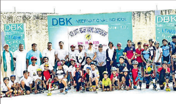
जिला स्तरीय रोलर स्केटिंग प्रतियोगिता में भाग लेने वाले खिलाड़ी अतिथियों के साथ।