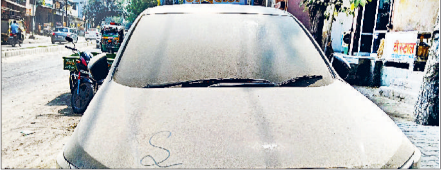
जीद। यहां खड़ी एक कार पर जमा रेत।